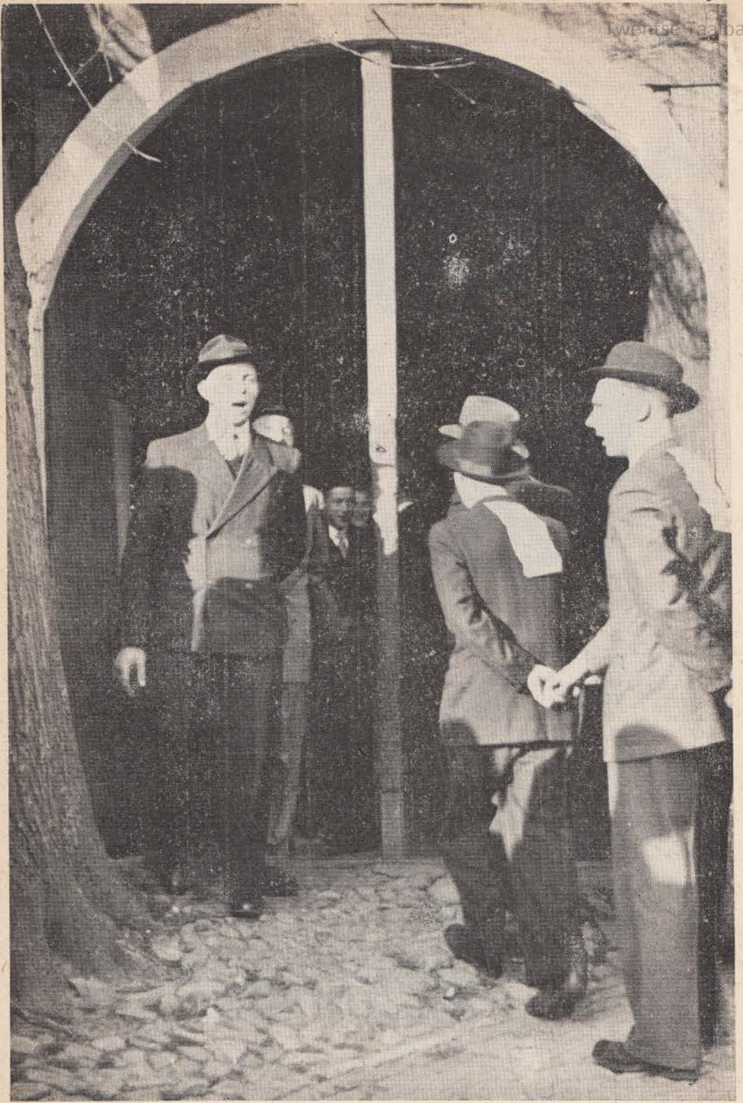
VLÖGGELEN in Oortmuske „Christus is opgestanden - al van de Joden hun handen”