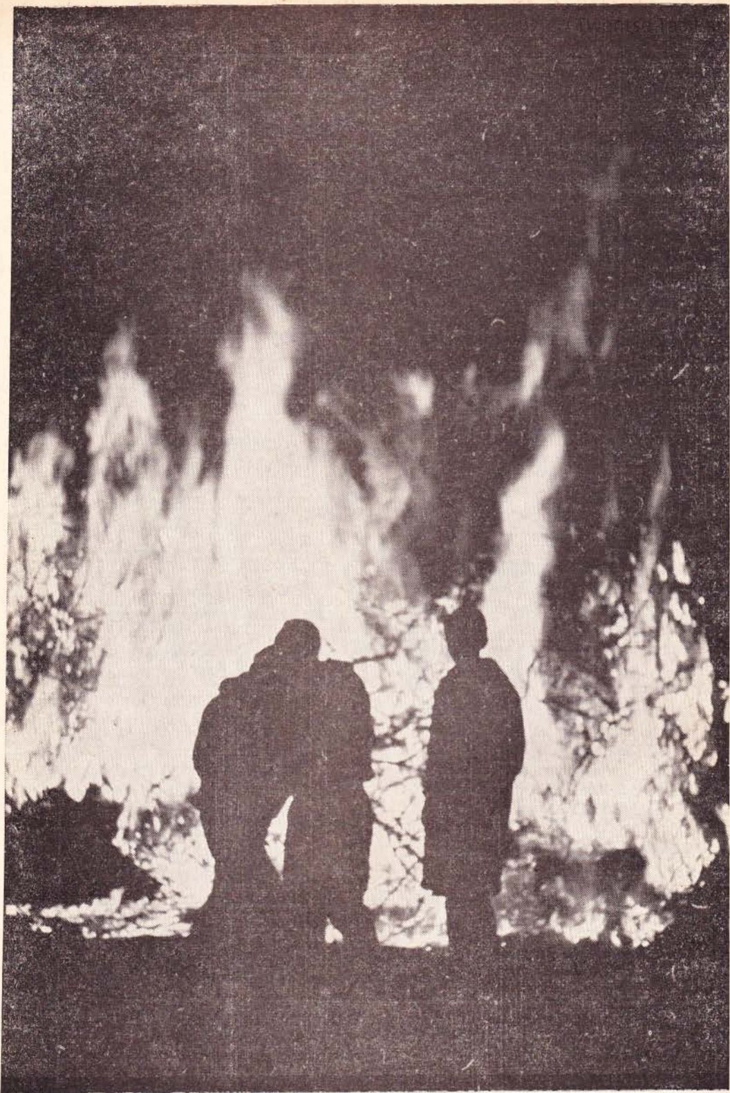
PAOSBAOKEN in Twente. Blijheed aover Christus' Verriezenis